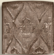
Die Kachel „Tapetenmuster“ im Kachelofenmuseum in Steyr

Die Keramik Manufaktur Sommerhuber schöpft aus ihrer jahrhundertelangen Geschichte, die bis in die Renaissance zurückreicht. Ein wahrer Schatz wurde im Sommerhuber Kachelofenmuseum in Steyr gehoben – die Kachel „Tapetenmuster“ erstmals hergestellt um das Jahr 1570 in Steyr. In der Renaissance waren die Kachelöfen mit dem „Tapetenmuster“ in Jagdschlössern und Bürgerhäusern anzutreffen.