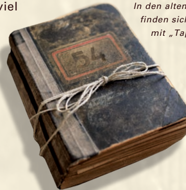
In den alten Auftragsbüchern finden sich Kachelöfen mit „Tapetenmuster“

Aber auch in den 1960er- und 1970er-Jahren waren diese Kacheln im städtischen Bereich weit verbreitet. Die aktuellen Entwürfe der Keramik Manufaktur Sommerhuber verbinden neue Technik mit viel Liebe zum Detail – wie der integrierten Sitzbank – und die Tradition der Kachelherstellung zu einem überraschend zeitgemäßen Kachelofen.