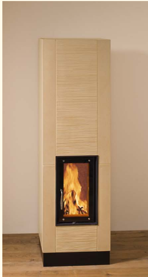
2072: Vollspeicherkerachelofen eckig Glasur: sahara