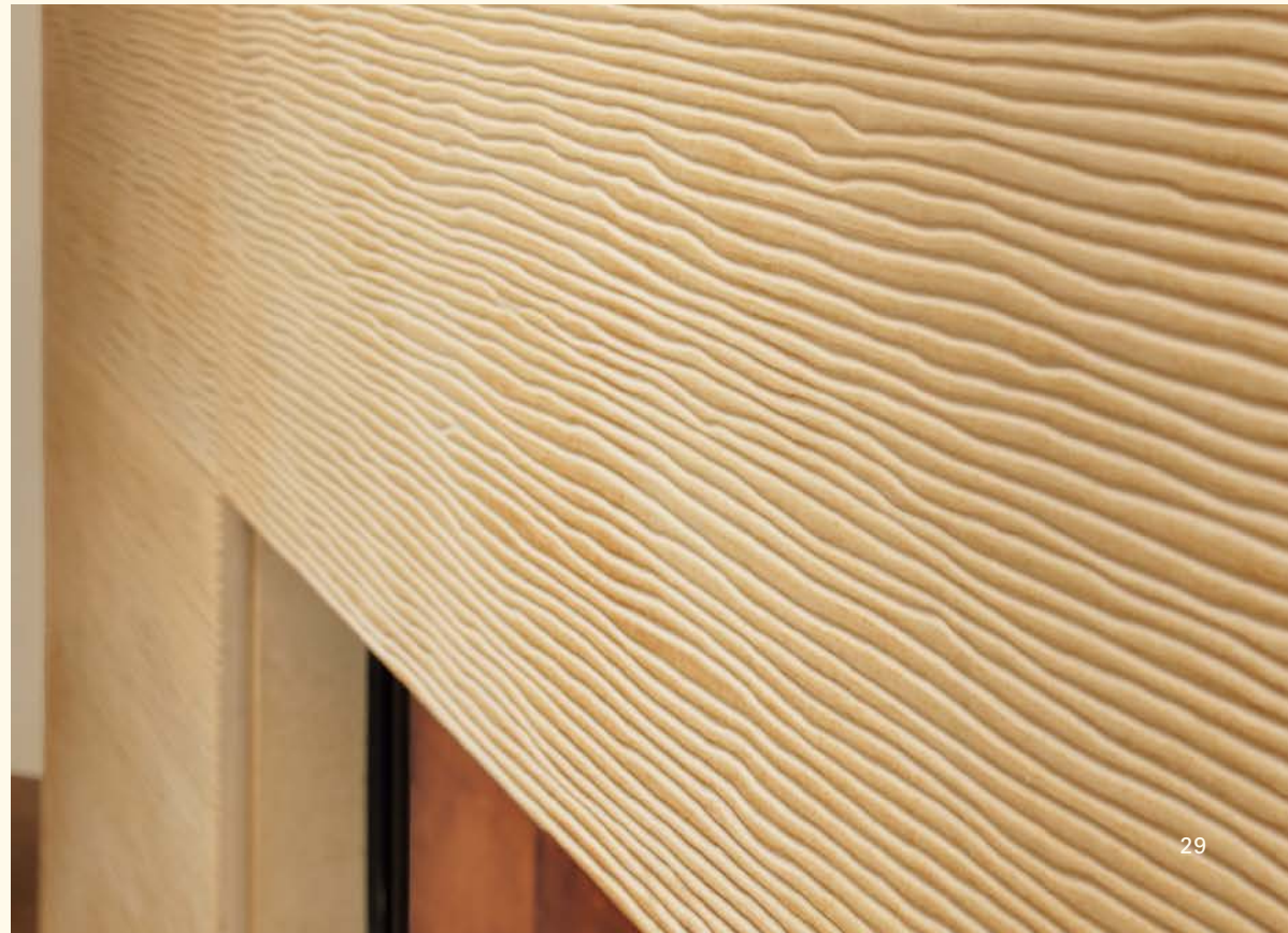
2044_2: Feuerkachel Maximus 241 Rille quer Glasur: solnhofen Technik: Spartherm KE 240