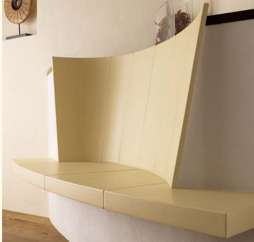
2047_1: Feuertisch 179 Rückenschild 378 Glasur: cacao dunkel, perla Technik: Brunner KE 351

„Die Entdeckung der Langsamkeit“ – ein wunderbares Buch. Sich Zeit nehmen um die Tätigkeiten des täglichen Lebens mit der Aufmerksamkeit zu verrichten, die ihnen gebührt – mit Freunden zusammensitzen und reden, ein Buch lesen oder gedankenverloren in das Feuer blicken. Tätigkeiten aus denen wir die Kraft für den Alltag schöpfen.