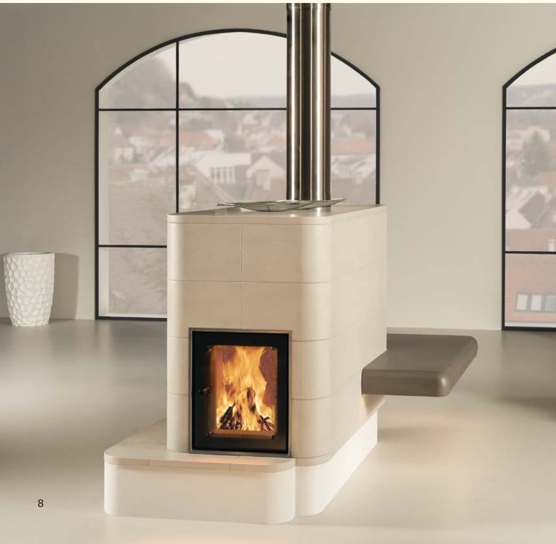
2092: Feuertisch Soft 177 Kachel 378, Plattsims 387 Glasur: taupe dunkel, taupe hell Technik: WGS KE 497

Die Reduktion auf das Wesentliche war schon immer eine besondere Herausforderung. Die großen keramischen Flächen ermöglichen die klare Umsetzung der Funktion des Wärmens. Es entsteht ein einzigartiges Raumgefühl durch KACHEL GANZ GROSS.