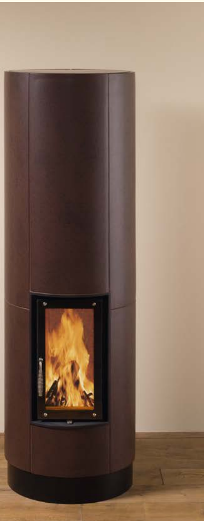
2071: Vollspeicherkerachelofen rund Glasur: umbra